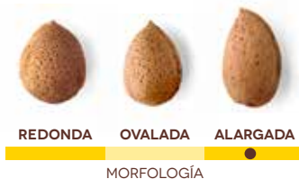
REDONDA OVALADA ALARGADA MORFOLOGÍA

turrones (duros, blandos, girlache), chocolates, bombones, grajeados. Especial para servir como aperitivo saludable, con piel o repelada, tostada o frita.