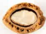
Sección en cáscara